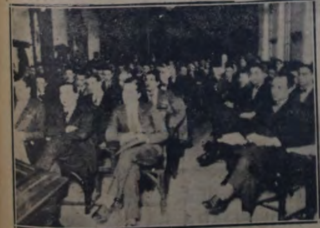
CONCURRENTES AL ACTO